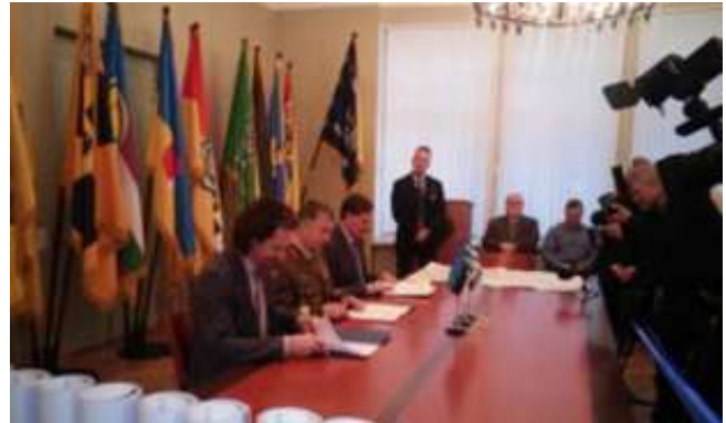
Kolmepoolse koostöölepingu allkirjastamine 01.02.2017

Kalevi Keskstaadion valmis 1955. aastal ning selle ehitamisel lõi kaasa palju vabatahtlikke kalevlasti. Kalevlaste endi keskel ja kalevlaste käte toel on staadionist saanud aegade jooksul sümbol, mis on platvormiks olnud paljudele üleriigilistele ja rahvusvahelistele võistlustele ja kultuuriüritustele.