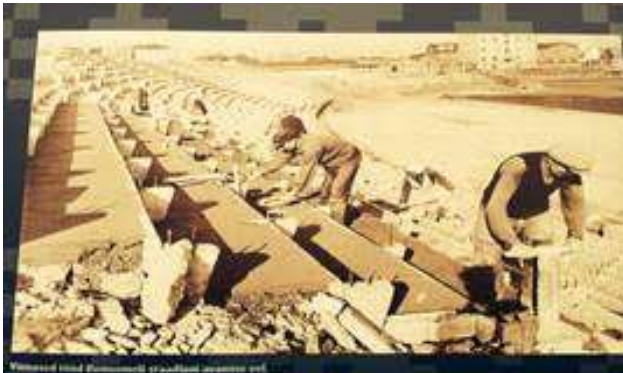
Kalevi staadion 1955

Kalevi Keskstaadion valmis 1955. aastal ning selle ehitamisel lõi kaasa palju vabatahtlikke kalevlasti. Kalevlaste endi keskel ja kalevlaste käte toel on staadionist saanud aegade jooksul sümbol, mis on platvormiks olnud paljudele üleriigilistele ja rahvusvahelistele võistlustele ja kultuuriüritustele.